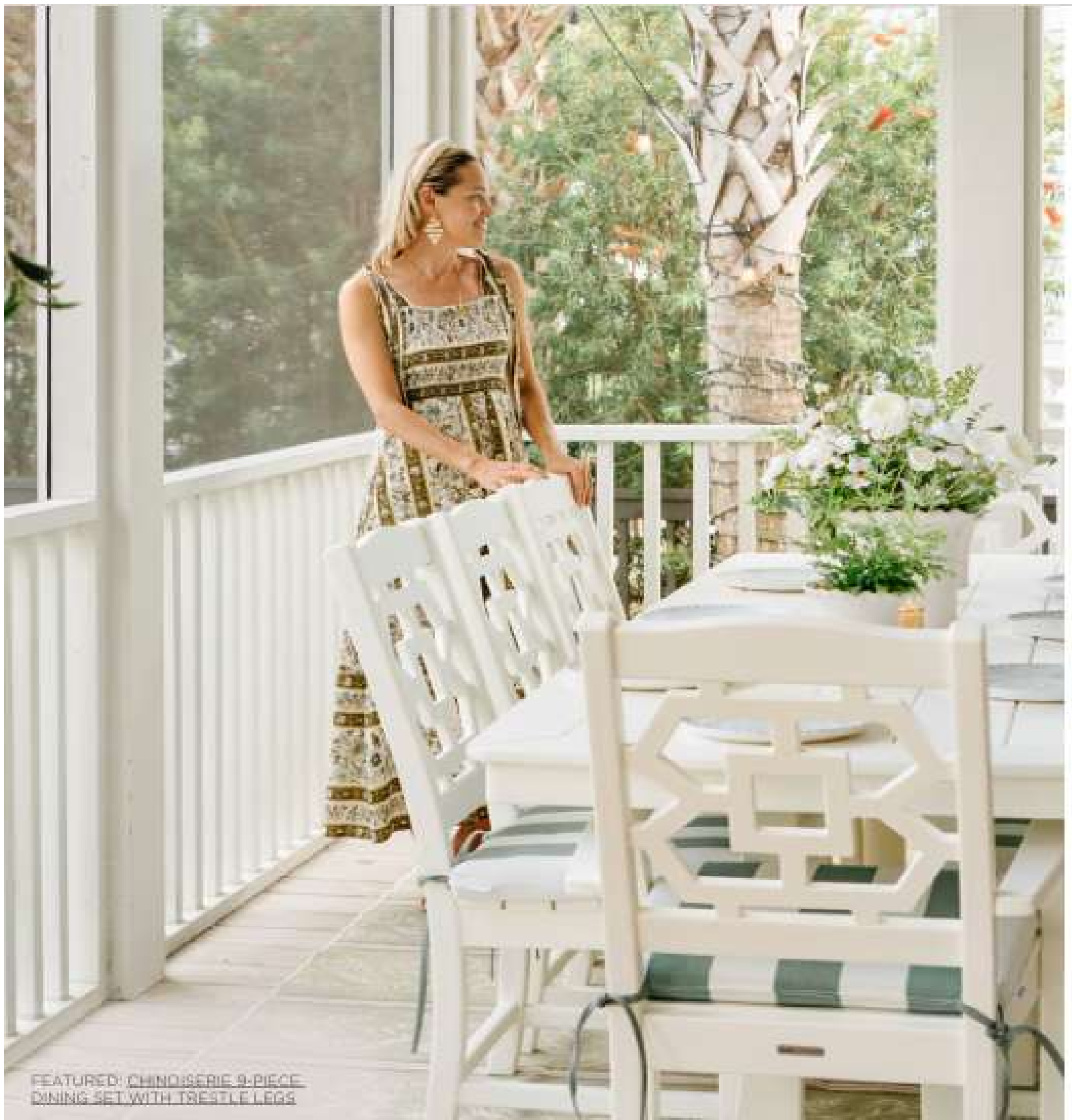
FEATURED: CHINDI SERIE 9-PIECE DINING SET WITH TRESTLE LEGS