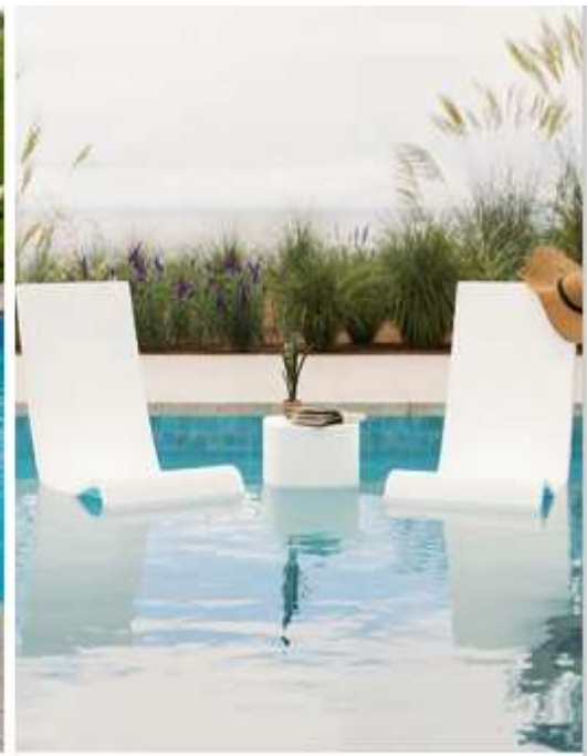
FEATURED: NAUTICAL CHAISE WITH ARMS & WHEELS (LEFT), CHIPPENDALE BAR CART (MIDDLE), LAGUNA 3-PIECE IN-POOL CHAIR LOUNGE SET (RIGHT)